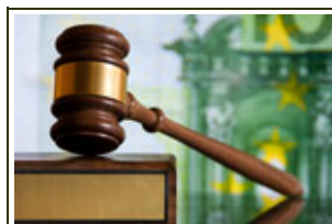
Cobro morosos (judicial)